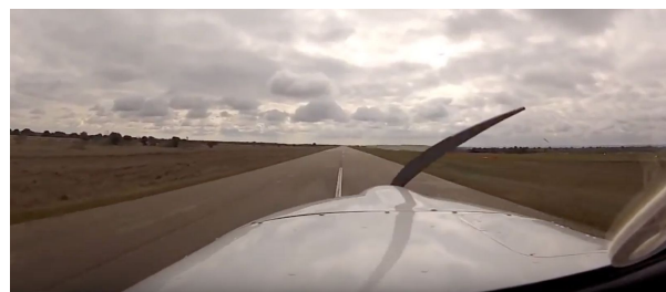
Figura C. Foto de un aterrizaje perfectamente alineado con el eje de la pista.

Y aquí tenemos una foto que muestra una buena alineación con la pista: